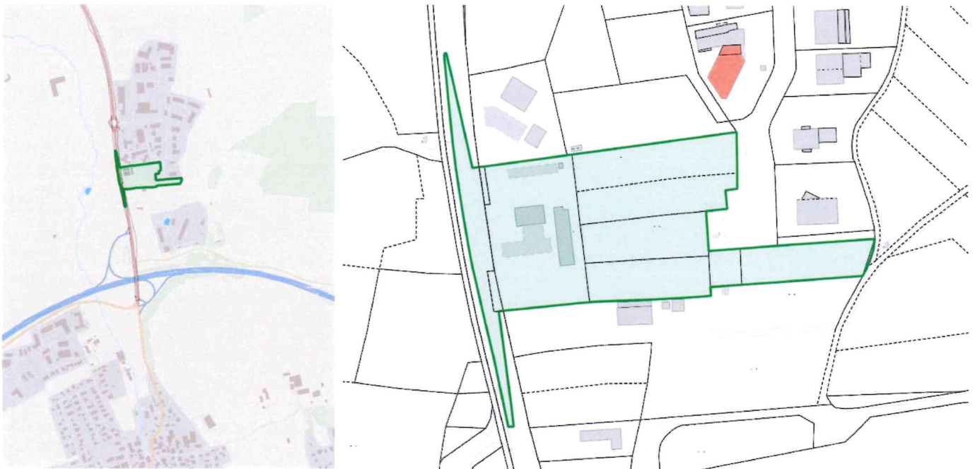
Lageplan und Umgriff der 1. Änderung des Bebauungsplans – ohne Maßstab

Der Geltungsbereich ist aus dem folgenden Lage-/Übersichtsplan ersichtlich: