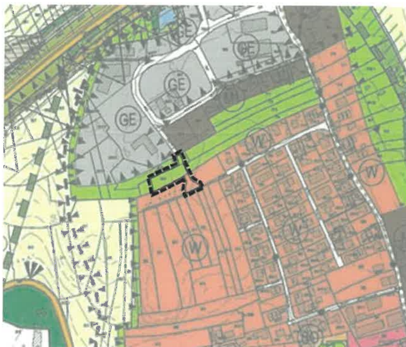
Ausschnitt aus dem rechtswirksamen FNP mit dem Bereich der 5. Änderung, o.M.

Die 5. Änderung des Flächennutzungsplans erfolgt entsprechend den Maßgaben des § 5 BauGB als vorbereitender Bauleitplan und wird im Regelverfahren durchgeführt.