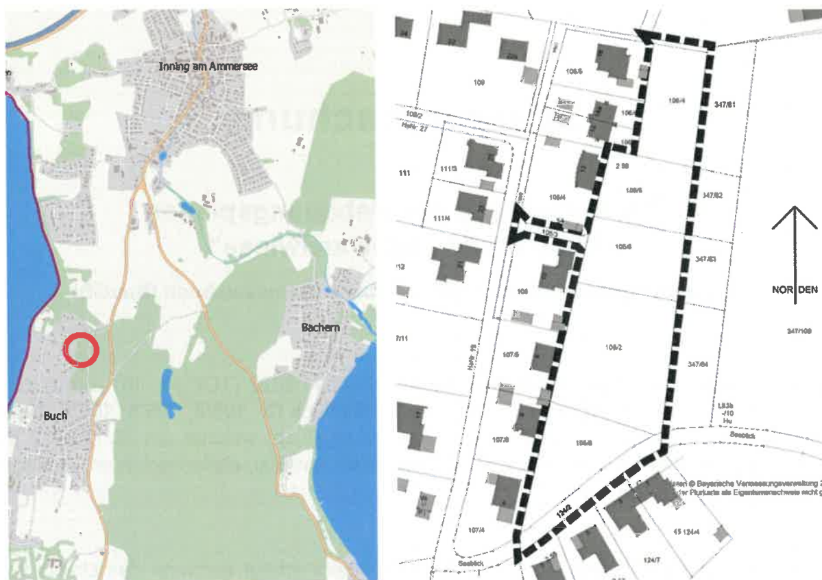
Lageplan: Gemeinde Inning am Ammersee, Ohne Maßstab

Der Geltungsbereich ist dem nachfolgenden Lageplan zu entnehmen: