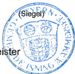
Bleimaier Erster Bürgermeister

Ortsüblich bekanntgemacht durch Anschlag an den Amtstafeln