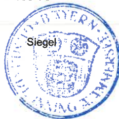
Bleimaier Erster Bürgermeister

Ortsüblich bekanntgemacht durch Anschlag an den Amtstafeln