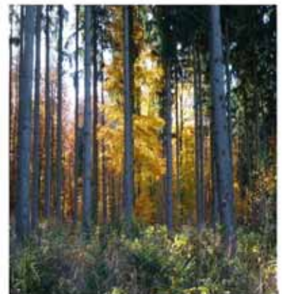
Robert Volkmann Wald und Holz - einst und jetzt „Bluembesuch“, „Dechel“, „Pechler“, „Gerber“ und die „Holznot“ Aber: Nennungen des Waldes in früheren Zeiten - und ein Blick auf heute Probleme Sonderheft der Inninger Geschichtsblätter

Die 15. Geschichtsblätter „Wasser satt“ gibt es nur noch in Restbeständen.