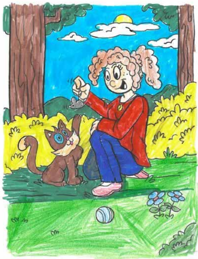
Finn Futterknecht, 7 Jahre