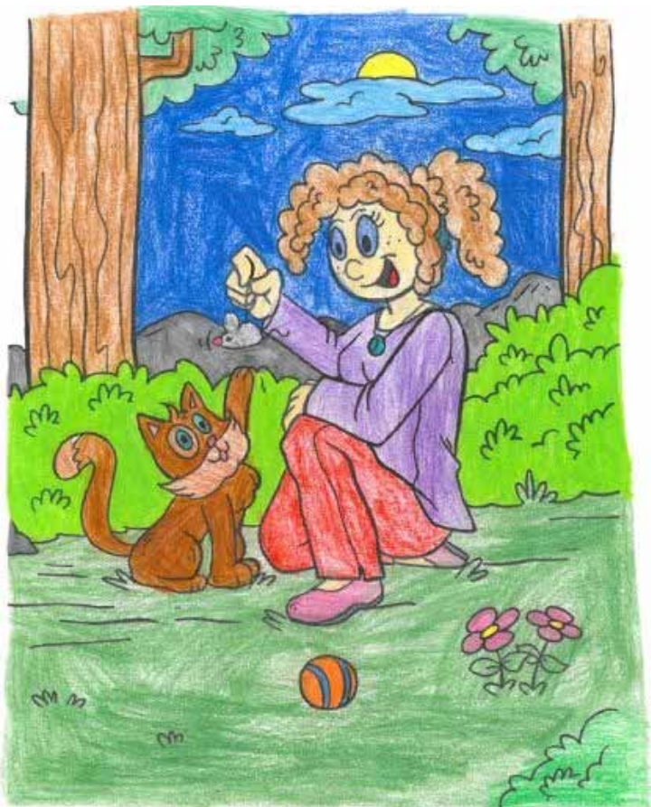
Fanny Futterknecht, 7 Jahre

Wir danken den kleinen Künstlerinnen und Künstlern für die Teilnahme an unserem Malwettbewerb und die schönen eingeschickten Bilder.