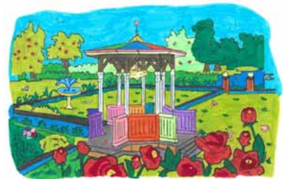
Veronika Ismair, 8 Jahre

Wir danken allen kleinen Künstlerinnen und Künstlern für die Teilnahme und die schönen eingeschickten Bilder.