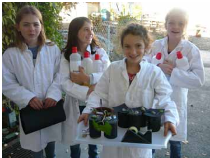
Junge Montessori Forscherinnen unterwegs

22 Kinder im Alter von 3-6 Jahren lernen im bilingualen Montessori Kinderhaus. In einer sehr familiären Atmosphäre werden sie von zwei Erzieherinnen und einer pädagogischen Fachkraft für Englisch betreut. Dieser gute Betreuungsschlüssel ermöglicht gute Förderung und individuelle Betreuung. Selbstständigkeit, soziale Kompetenz und das frühe, spielerische Erlernen von Lesen, Schreiben und Rechnen sind wichtige Ziele der Montessori-Pädagogik.