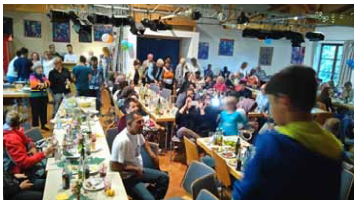
Besucher Integrationsfest in Inning

Das Team des Dauerflohmärktes "Hand in Hand" veranstaltete parallel einen Sommerschlussverkauf. Im gemeinsamen Miteinander kamen sich alle ein Stückchen näher und so wurde durch das Fest wieder klar: Wir in Inning schaffen es, friedlich miteinander zu leben.