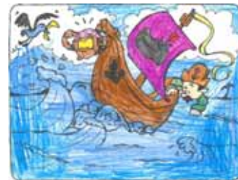
Fanny Futterknecht, 5 Jahre

Vielen Dank an alle Kinder für die Einsendung der tollen Ausmalbilder! Hier unsere zwei Gewinner: