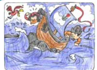
Finn Futterknecht, 5 Jahre